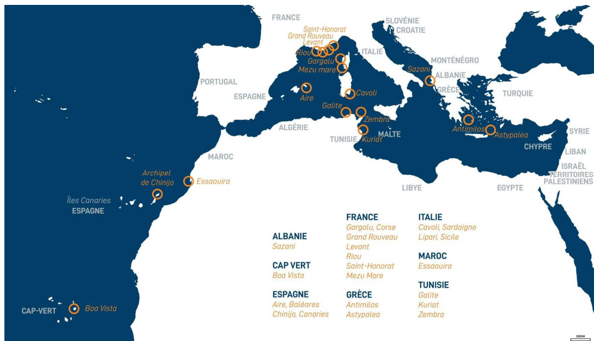
Figure 1: Sites partenaires d'Initiative PIM (2025)

Initialement concentrées sur le bassin ouest méditerranéen, les actions de PIM s'étendent aujourd'hui à l'est de la Méditerranée et à la Macaronésie (France, Espagne, Maroc, Tunisie, Monténégro, Albanie, Grèce, Italie, Cap-Vert), renforçant son rôle de réseau méditerranéen de référence.