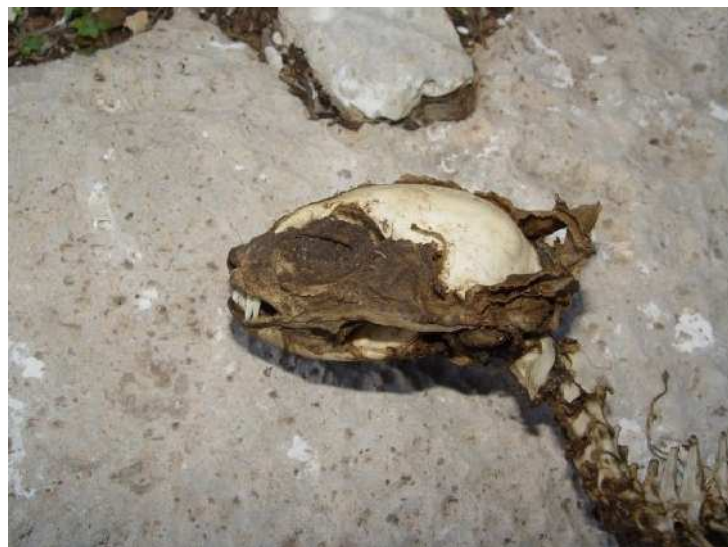
Indice de présence d'un prédateur : squelette d'un chat haret sur le site de reproduction à Oued Zitoun