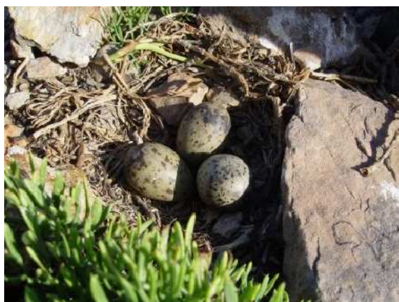
Ponte de trois œufs

Site de nidification de Goéland d'Audouin, le rocher aux Goélands