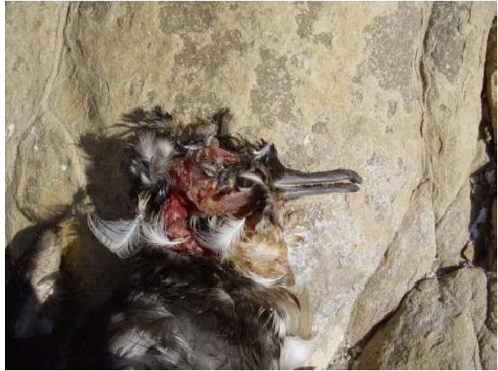
Trace de prédation sur un adulte d'un puffin

A signaler également qu'un groupe d'une vingtaine de Puffin de Méditerranée ont été recensés au large de Zembretta en septembre 2008, 3 en septembre et quelques individus entendus sur l'île en novembre 2009.