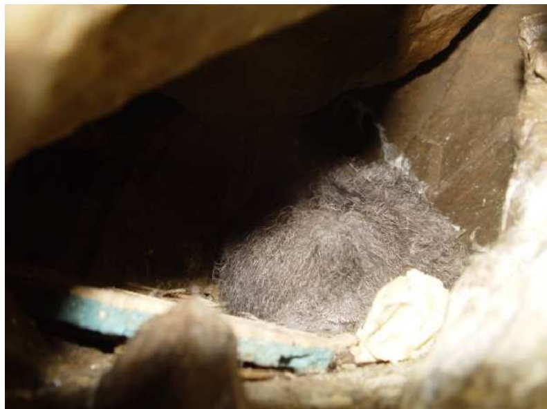
Un poussin de puffin yelkouan

Une petite colonie de Puffin de Méditerranée ( Puffinus yelkouan ) a été découverte en mai 2008 dans les gros éboulis de la partie sud-ouest de Zembretta (Ouni & Vidal 2008). Au vu du nombre de terriers fientés, cette colonie regroupe quelques dizaines de couples, mais seulement sept couples ont été répertoriés et suivis au cours de cette année (2008). Des prospections complémentaires ont été réalisées au cours de l'année 2009 entre juin et novembre dans le but d'obtenir une estimation satisfaisante du nombre de couple. Ces prospections ont permis de redécouvrir d'autres nids (18 nids) dans les grands éboulis du versant Ouest et Sud et dans les falaises Sud du plateau de Zembretta. De même quelques nids (2 nids) ont été répertoriés sur l'île de Zembrettino au cours de la dernière mission d'automne situés à la limite de falaise du versant Sud de l'île.