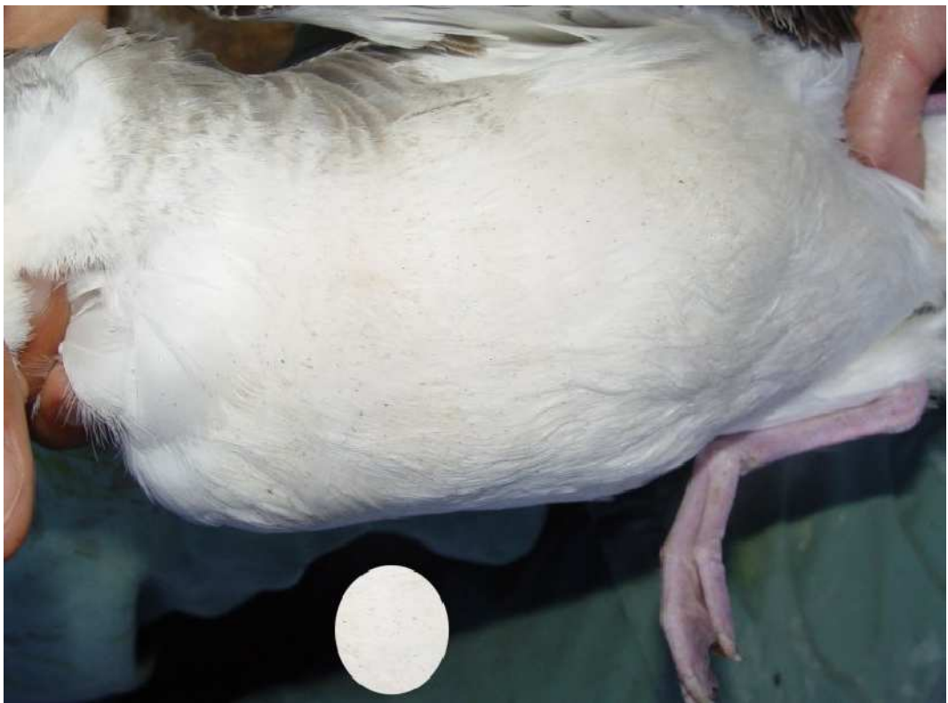
Les points noirs sur les plumes ventrales de puffin sont des acariens.

Les puffins cendrés ont été fortement infestés par des ectoparasites. Sur la grande majorité de ces individus, nous avons trouvé trois espèces de poux qui vivent sur différentes parties du corps de l'oiseau : une sur la tête, une sur la poitrine et la troisième vit sur les ailes ( probablement : Halipeurus abnormis, Austromenopon echinatum et Saedmunssonsonia peusi ). Une espèce de puce ( Xenopsilla gratiosa ) et des acariens de plumes (espèces inconnues pour l'instant). Sur les goélands leucophée et d'Audouin on a trouvé une seule espèce d'ectoparasite : la tique molle de type Ornithodoros (en cours de détermination), les goélands leucophées ont été les plus infestés par cette espèce.