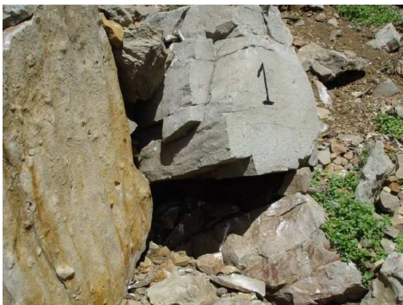
Le 1 er terrier de puffin trouvé