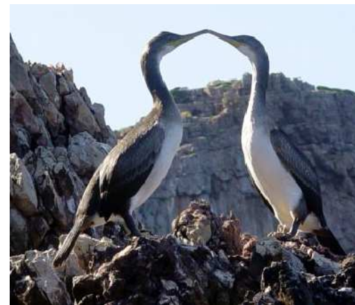
Deux jeunes de l'année photographiés ➤ en 2008 à Cappel Grosso