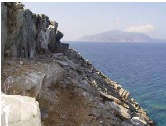
← Site de nidification de cormoran huppé à Zembrettina

Les Cormorans huppés se reproduisant en hiver, les observations sur le suivi de la reproduction doivent s'effectuer entre les mois de novembre et mars/avril.