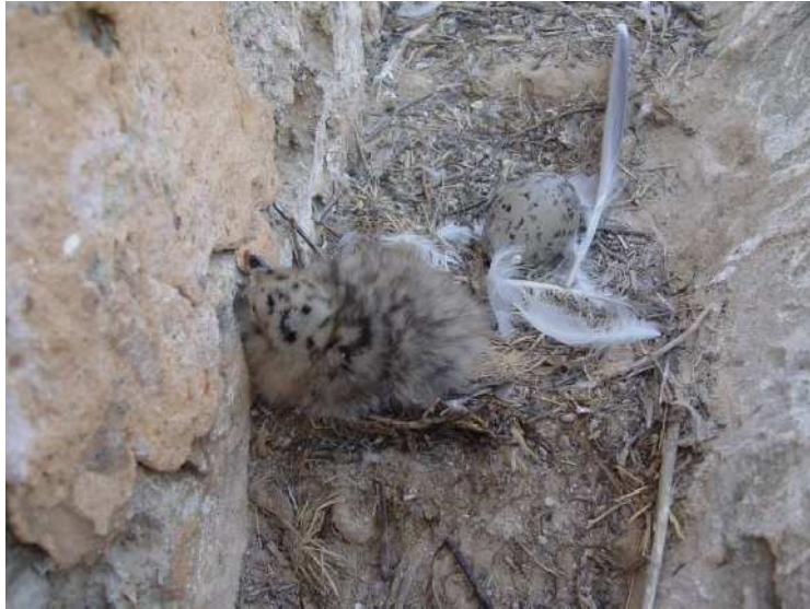
Une ponte de deux œufs dont un poussin éclos

population mérite un suivi pour évaluer le nombre des couples reproducteurs et le succès de reproduction, et en étudier le régime alimentaire).