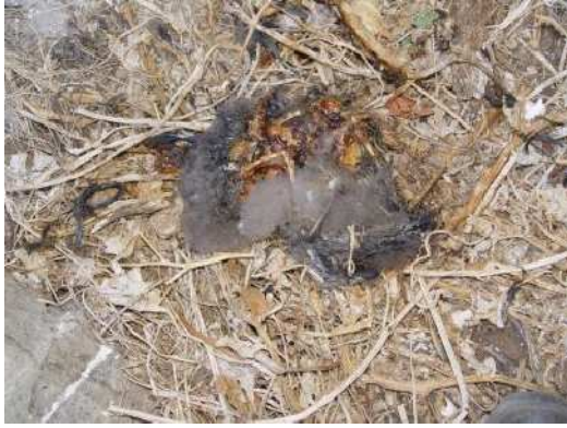
Trace de prédation sur un poussin