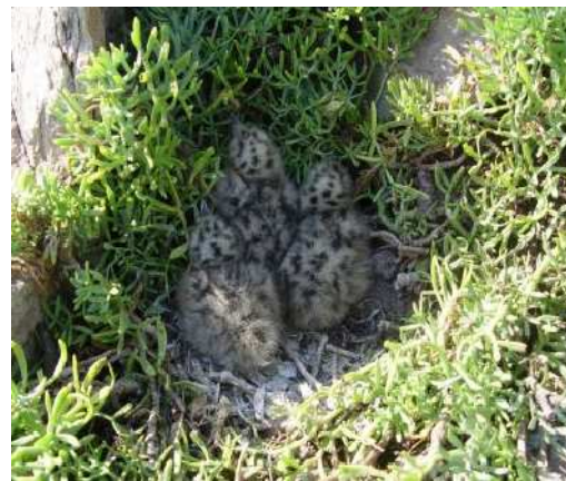
trois poussins éclos