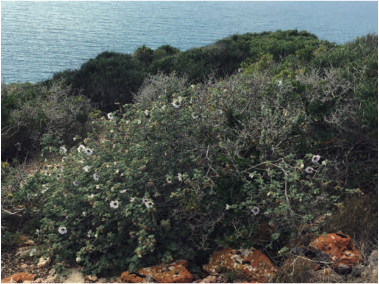
Figura 2. Lavatera maritima a l'illot de na Redona al 2018. (Foto: Joan Rita).