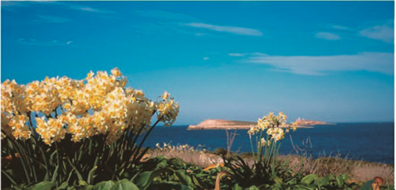
Figura 1. Narcissus tazetta és una espècie especialment abundant als illots de Cabrera. A part de a Cabrera Gran, la trobem a l'illa des Conills –on fa unes extenses catifes que desprenen una forta i dolça fragància–, a Na Redona, i a L'Imperial.

Excepte a l'illa des Conills, la vegetació halòfila litoral ocupa una gran superfície. En alguns illots, com és el cas dels Estells, illa de ses Bledes, na Plana i na Foradada, aquest tipus de vegetació és l'única existent. L'espècie Suaeda vera és el matoll halòfil crassulent dominant a la franja litoral de la major part dels illots, juntament amb Sarcocornia fruticosa .