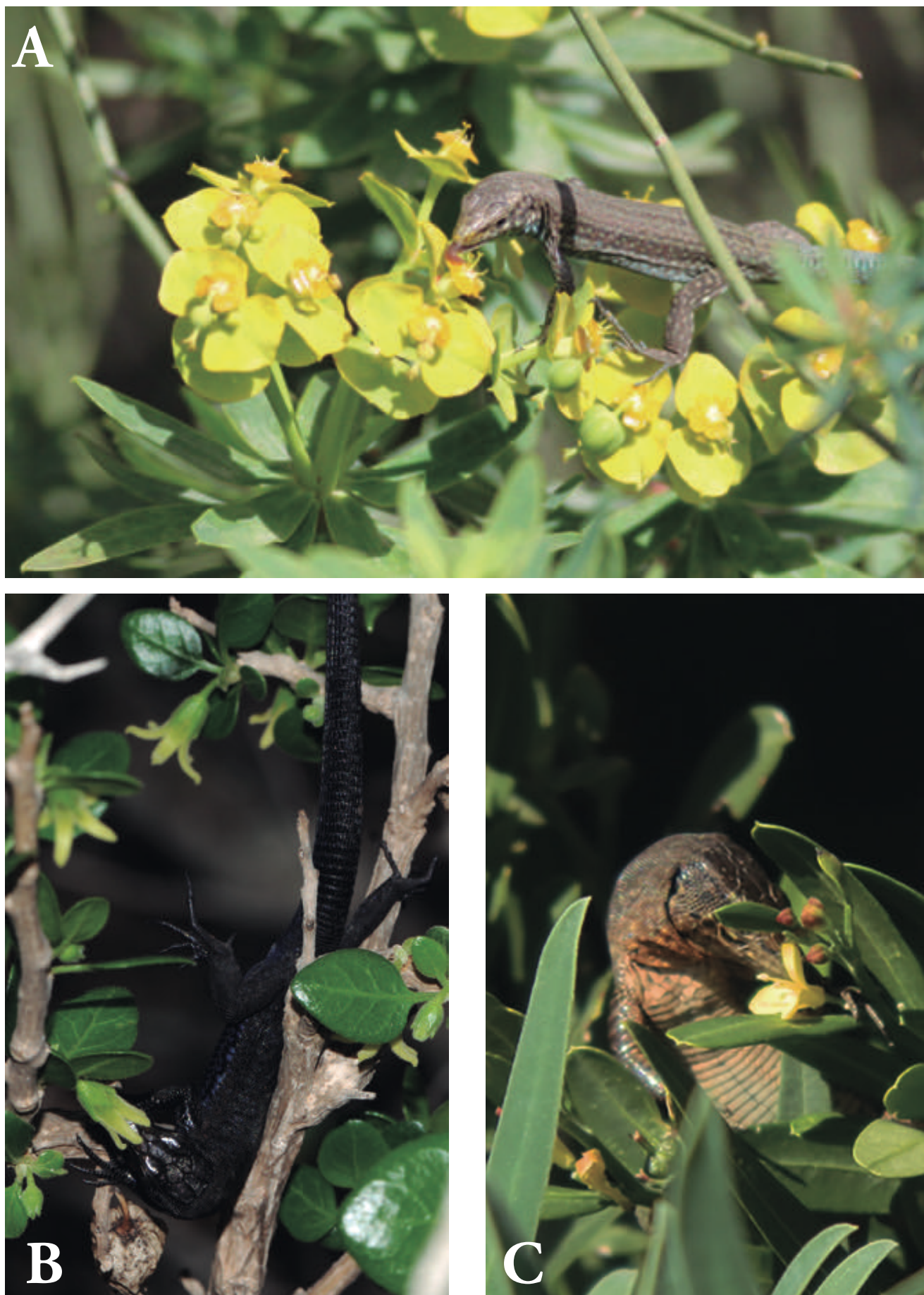
Figura 6. La sargantana balear, Podarcis lilfordi , visita les flors i fa de pol·linitzadora efectiva d'un bon nombre de plantes. Sobre les flors de (a) Ephedra fragilis , (b) Withania frutescens , i (c) Cneorum tricocon .