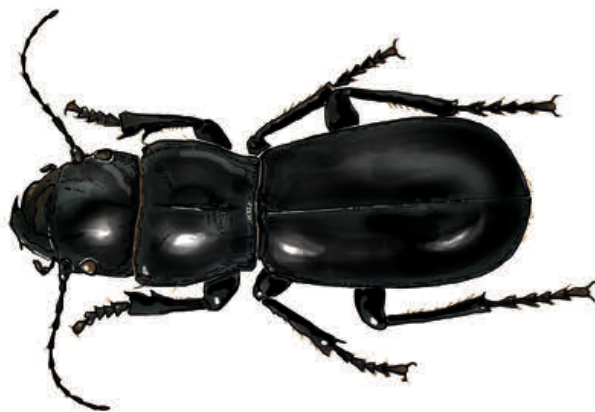
Figura 3. Exemplar de Percus espanyoli . Aquesta espècie de caràbid és endèmica de l'arxipèlag de Cabrera i s'ha trobat exclusivament a Cabrera Gran i a l'illa des Conills. És un gran depredador, té hàbits nocturns i una gran resistència a les condicions més adverses i diverses. (Dibuix: Xavier Canyelles).

Dins els caràbids, hi ha 6 espècies a Cabrera. Una d'elles és Percus espanyoli (Fig. 4) que és endèmic de l'arxipèlag, trobant-se a l'illa gran i també a l'illa des Conills; es tracta de l'escarabat depredador per excel·lència, d'hàbits nocturns, i que té una gran resistència a les condicions més adverses i diverses, que fan que sigui abundant en molts hàbitats (Palmer i Petitpierre 1993). Un altre escarabat, en aquest cas de la família dels histèrids és Macrolister major i de distribució a l'oest de la Mediterrània; és un depredador de larves de diferents dípters necròfils i és relativament freqüent als cadàvers d'aus marines; per aquesta raó, a part de a Cabrera Gran, es troba a alguns illots com na Foradada i na Plana, on hi ha gran presència d'aus marines.