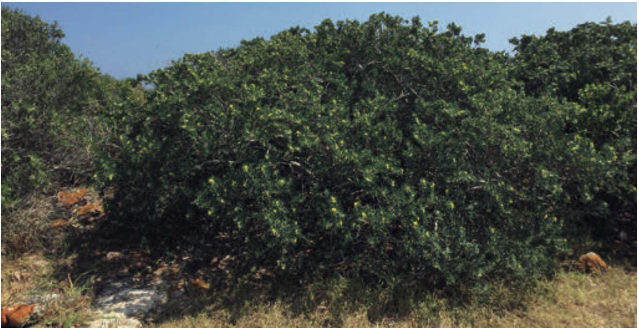
Figura 4. Individu de Medicago citrina a na Redona. Aquesta espècie va ser introduïda en aquest illot al 2002 i s'ha establert exitosament, formant una petita població en la part alta, on hi ha més profunditat de sòl, característica necessària per a que aquesta lleguminosa pugui arrelar bé i resistir els estius calorosos i secs. A part de a na Redona, es troba exclusivament a l'Illot de ses Bledes, a l'Estell des Coll i l'Estell de Fora.

La fauna d'aucells i de sargantanes és tractada en detall en dos altres capítols de la present monografia (Carbonell et al., 2020; Pérez-Cembranos et al., 2020) i, per tant, no la tractarem aquí. Ens restringirem a les espècies de vertebrats que han habitat els illots de Cabrera en un passat degut a la seva introducció pels humans; concretament ens referim a quatre espècies que actuen com importants herbívors i que poden arribar a devastar la vegetació dels illots: cabres, ovelles, conills i rates. Aquesta destrucció de la vegetació deguda als herbívors ja va ser constatada per A. Palau (1976) quan va visitar l'arxipèlag de Cabrera al final dels '40 i principi dels '50 del segle XX. Ho expressà d'aquesta manera tan gràfica: "Les illes més grans són ben sovint delmades pel bestiar que hom hi desembarca i hi abandona fins que tingui esgotat l'escàs herbei que creix entre mig dels matolls i a les esclertes de les roques. És per això que hom troba herbes inaprofitables per a col·leccions, gramínies arranades que difícilment arriben a florir (...). La Lavatera maritima de la garriga de na Redona resta reduïda a un petit matoll arrap al sòl o a les roques, d'intricades i gruixades branques, molt curtes perquè el bestiar l'esbrota tan sovint que no li permet la creixença normal".