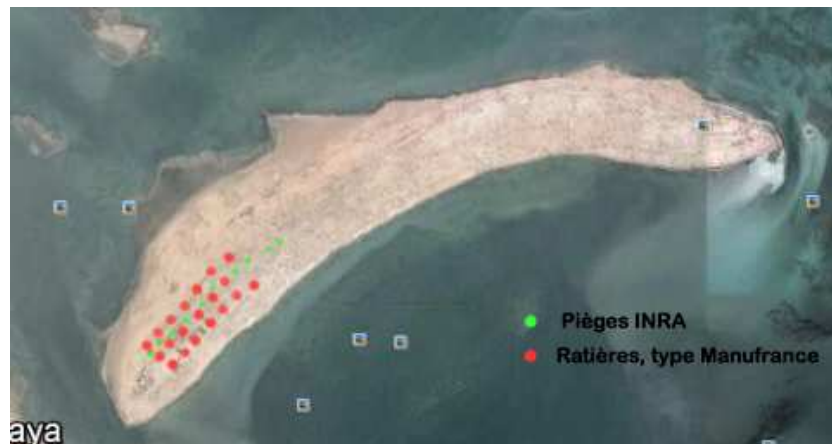
Figure 4- : Disposition du piégeage mise en place la nuit de 27 mars

La pose de 20 ratières, type Manufrance (pour les rats) et 10 pièges INRA (pour les autres micromammifères type musaraigne, souris etc...) sur le versant ouest de l'île (fig. 4 et 5) n'a pas permis de détecter la présence de micromammifères. Compte tenu d'une seule nuit de piégeage, de conditions météorologiques défavorables à la capture de micromammifères et de l'emplacement du dispositif uniquement sur la partie ouest de l'îlot, nous ne pouvons pas affirmer l'absence de micromammifères sur cette zone. Notons, que des indices de présence (crottier, garde manger, terrier) a été décelé.