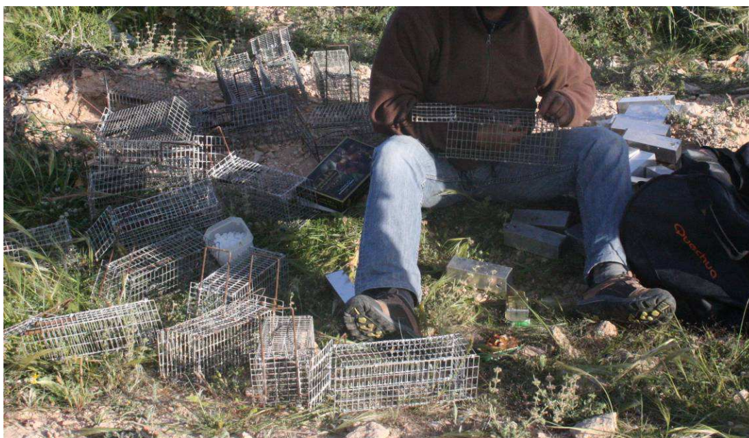
Figure 1. : Montage des pièges de type Manufrance (pour les rats) et INRA (pour les autres micromammifères type musaraigne, souris etc...).