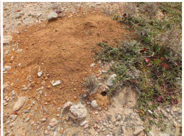
figure 9- : terrier d'une gerbille.