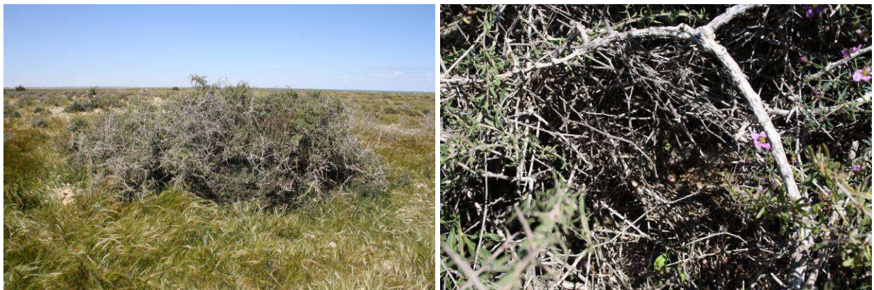
Figure 3- : Nid de Ratus ratus dans l'arbuste de Lycium Sp. .