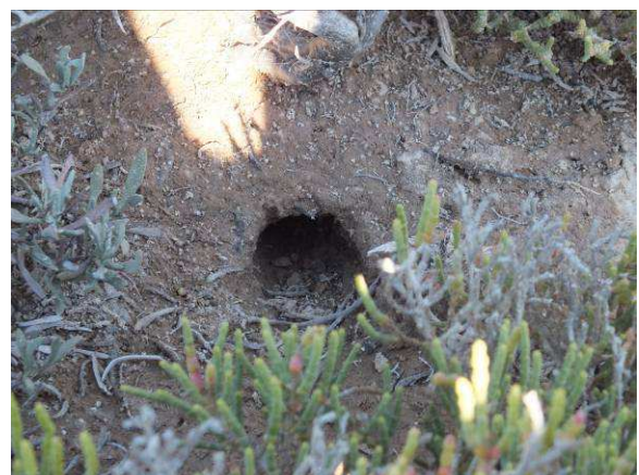
Figure 2- : terrier d'une gerbille sp observé sur Gremdi et Sefnou.