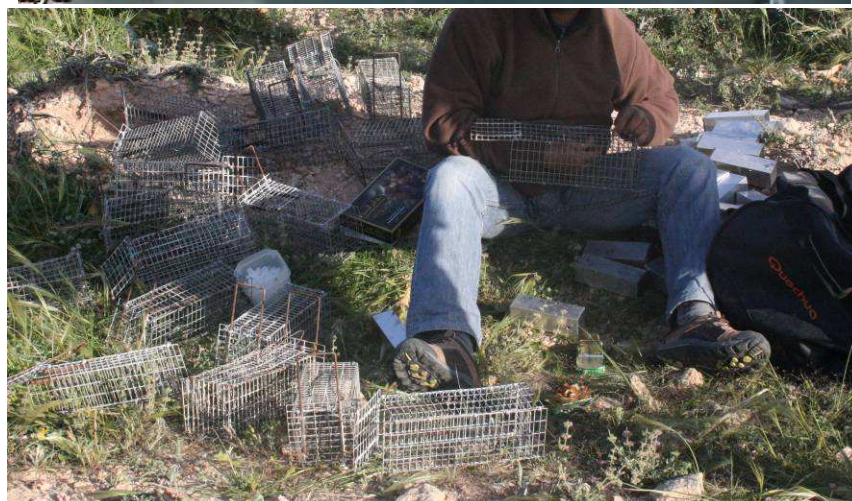
Figure 5- : Montage de dispositif du piégeage.

- Pour le lièvre Lepus capensis aucun indice de présence n'a été détecté.