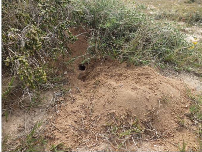
Figure 7- : Terriers observés.

Quatre heures de prospection n'est pas suffisant de mener des prospections sur l'ensemble de l'île qui dépasse le 150h. Seulement, environ, le 1/3 qu'a été prospecté au cours de notre mission, révélé la détection d'un seul indice de présence, fort probable, de Dipodillus simoni l'espèce endémique de l'Archipel. Au total cinq terriers on été trouvés, Trois sur la zone Ouest à couverture végétal halophile dense (fig. 7) et deux au sud de vestige archéologique. Rappelons que la zone est propice d'accueillir d'autre espèce comme le rat noir Rattus rattus , la souris grise Mus musculus .