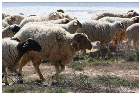
Figure 6- : troupeau de mouton résidant sur l'île de Gremdi.

On note aussi la présence d'un cheptel des moutons et des chèvres, environs une centaine d'individus (fig. 6).