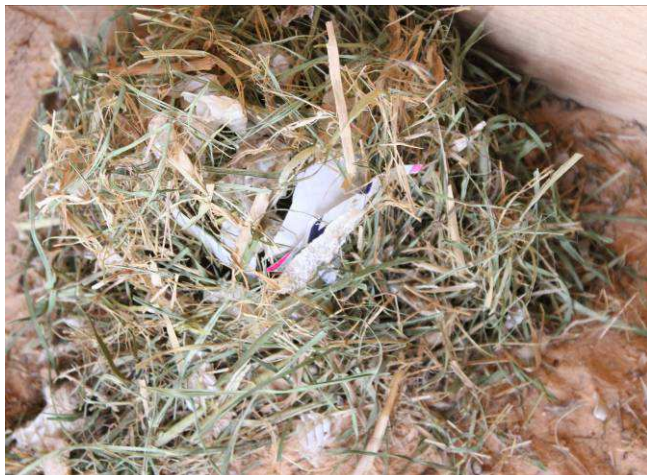
Figure 8- : Un nid d'une souris grise bâti dans une caisse en bois.