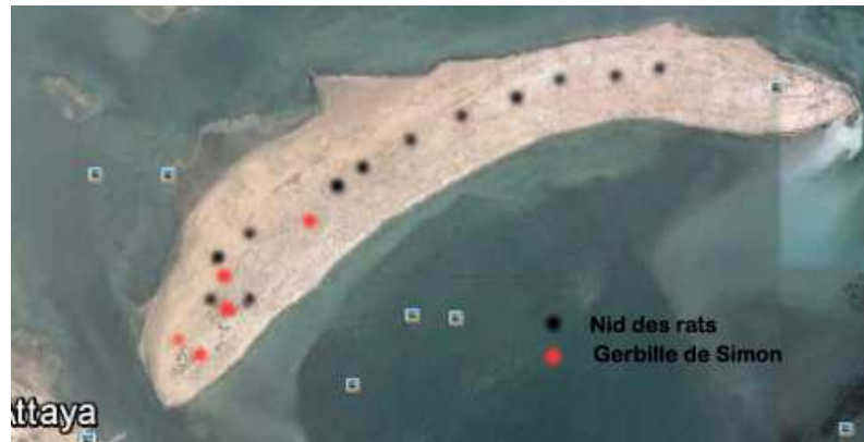
Figure 2- : Carte de distribution des mammifères sur Gremdi

Remarque, souvent en trouve un seul nid du rat battus dans la partie supérieure de l'arbuste mais sur cet île on a trouvé l'inverse, les nids sont édifés à mi de l'arbuste. Ainsi des installations de 2 nids côtes-à-cotes (30-50cm d'intervalle) est fréquent sur l'île. Rappelons que ce type d'installation n'est pas constaté sur le continent.