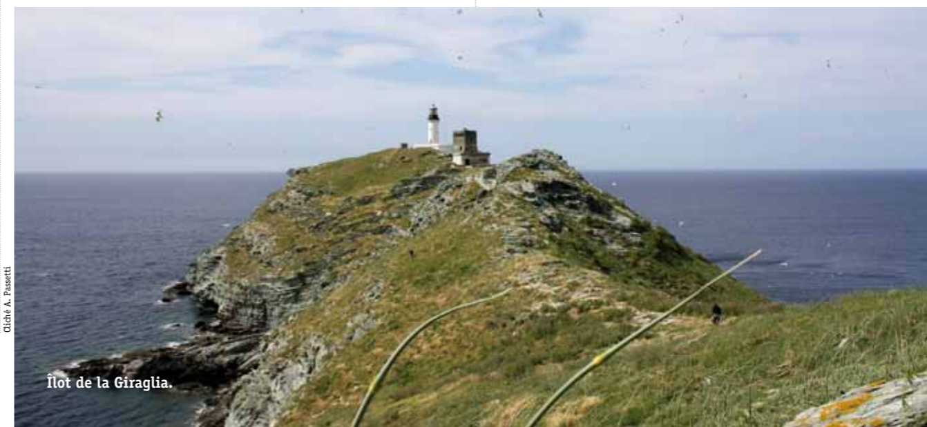
Îlot de la Giraglia.