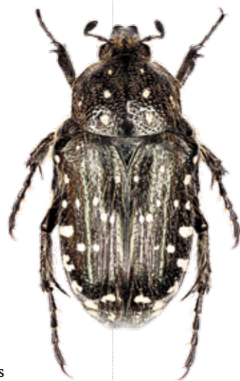
Oxythyrea funesta .

Oxythyrea funesta (Cetoniidae) est une petite cétoine noire et blanche à abondante pilosité claire. C'est une espèce extrêmement commune partout, aussi bien en Corse qu'en France continentale. Son nom vernaculaire peu flatteur (le "drap mortuaire") évoque probablement sa coloration qui tranche par sa sobriété avec les teintes métalliques de la plupart des autres cétoines. La faune française ne comprend, dans le genre Oxythyrea , qu'une seule espèce... qu'on ne confondra pas avec les