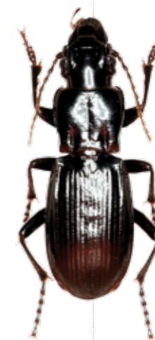
Percus corsicus .

Au cours d'une balade printanière sur les sentiers du maquis corse, il est difficile de ne pas remarquer les oedémères (Oedemeridae), saupoudrés de pollen et tourbillonnant autour des cistes en fleurs. Ces coléoptères assez grands se remarquent par leur coloration souvent métalliques, et la dilatation extraordinaire des fémurs postérieurs des mâles, présente chez beaucoup d'espèces de ce genre (mais pas toutes!), et dont la signification biologique exacte demeure inconnue. Sur les seize