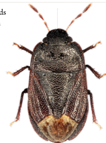
Ochetostethus melonii .

Les Carabidae ou carabiques constituent une famille riche en espèces "terricoles" (ce sont les ground beetles des anglophones), et la faune française en compte à peu près un millier. Les Percus sont de grands coléoptères carabiques entièrement noirs, le plus souvent observés en retournant les pierres sous lesquelles ils se réfugient pendant