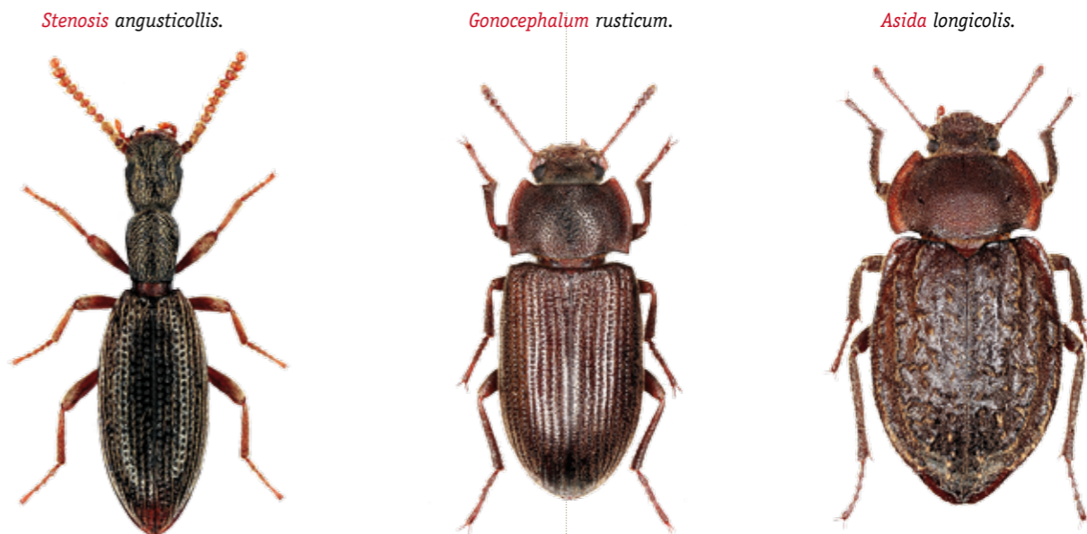
Stenosis angusticollis .

Cette famille de coléoptères est l'une des plus importantes dans les régions arides du globe car elle comprend beaucoup d'espèces bien adaptées physiologiquement à la sécheresse. En région méditerranéenne, les Tenebrionidae occupent aussi une place prépondérante, avec une diversité spécifique très élevée dans certains genres (les Asida sont représentés par environ 150 espèces dans l'ouest du bassin méditerranéen). La faune française comprendrait 168 espèces de Tenebrionidae, dont 83 pour la Corse. Il