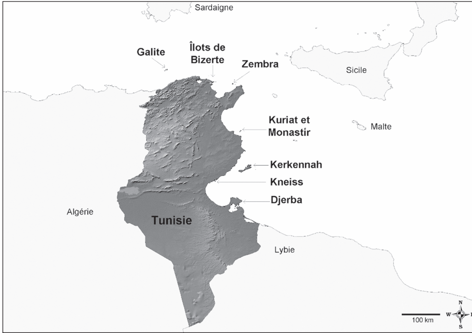
Fig. 1. Localisation générale des archipels présents le long des côtes de Tunisie (réalisation D. Pavon).