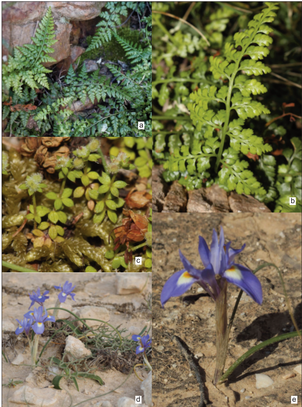
Fig 2. a, b) Asplenium balearicum Shivas, rochers ombragés du sommet de l'île de Zembra, 17.IV.2019; c) Galium minutulum Jordan sur l'île Zembra, 16.IV.2019; d, e) Moraea mediterranea Goldblatt: d) sur l'île Gremdi (Kerkennah), 29.III.2014, e) sur l'île Gataia el Gueblia (Djerba), 07.IV.2015.