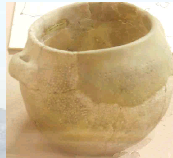
Poterie du Cardial (8000 B.P. île de Riou)