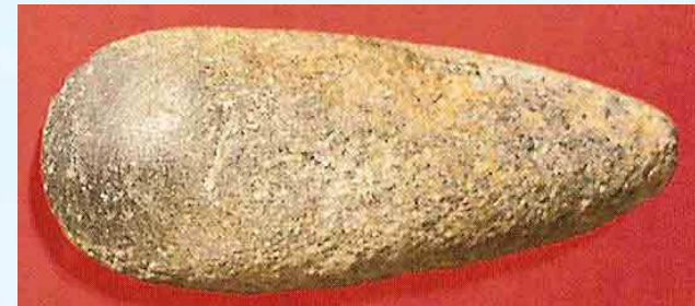
Hache de pierre polie