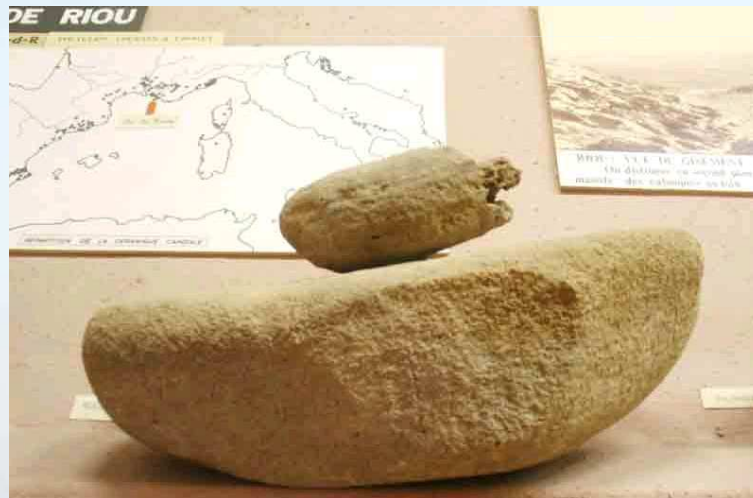
Meule de grès