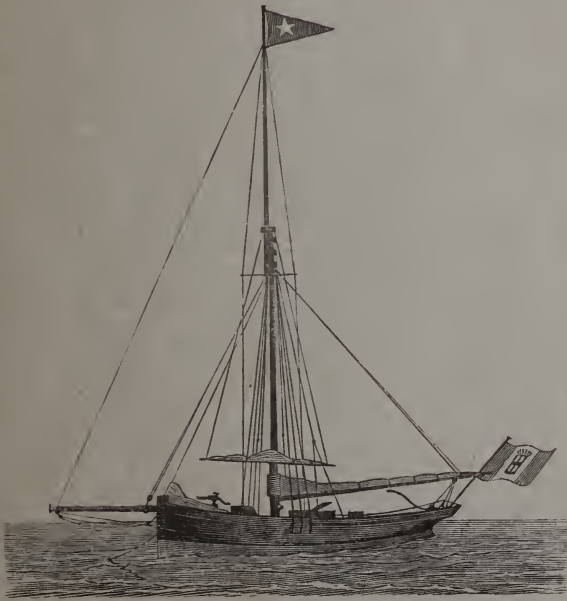
Cutter Violante .