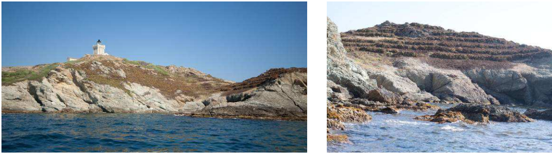
Zones arrachées en 2013

A l'instar du mode opératoire testé en 2012, toutes les zones accessibles sans danger pour les équipes d'arrachage non équipées pour les travaux en falaises ont été traitées. Le secteur « année 3 » a ainsi été entièrement dégagé des griffes de sorcière, excepté les parties plus accidentées nécessitant des équipes formées aux travaux en falaise.