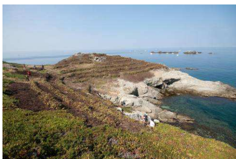
Eradication du secteur au cours de la mission. L'éradication s'effectue du bas vers le haut