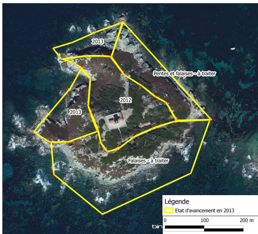
Carte 2 : Etat d'avancement de l'éradication de griffe de Sorcière, après la mission de juillet 2013

Ces 2 zones comportant des parties en zones très pentues/falaises et des zones plus planes. Une mission devra être programmée au printemps 2014 afin de définir les secteurs nécessitant soit une intervention spécifique (recrutement d'une entreprise spécialisée en travaux acrobatiques en milieu naturel, ou renouvellement d'un partenariat avec le Parc National de Port-Cros) soit une intervention "classique". Ceci permettra de mieux définir le nombre de personnes nécessaires pour chaque type de traitement, ainsi que le temps d'arrachage à fournir pour les prochaines opérations.