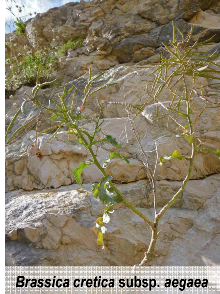
Brassica cretica subsp. aegaea