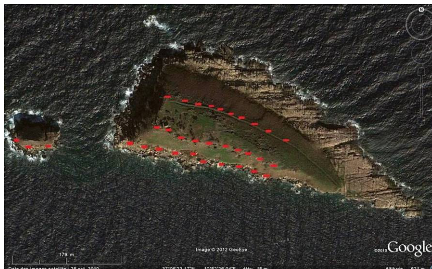
Les postes de piégeage