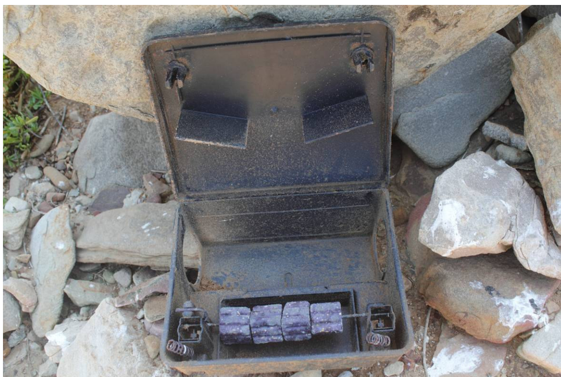
Boite de ré-infestation

Le contrôle des boites anti-réinfestations a montré l'absence de consommation des appâts empoisonnés aussi bien dans les postes intérieurs que les postes périphériques. Rappelons que ces boites ont été mise en place après la campagne d'éradication du rat noir en Novembre 2009.